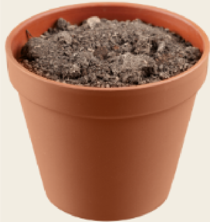
Matero de barro