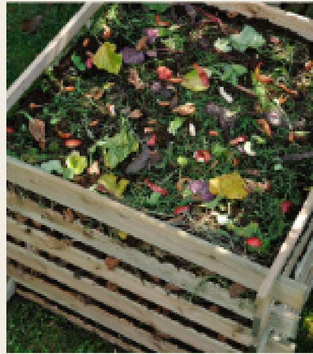
Cerco de madera